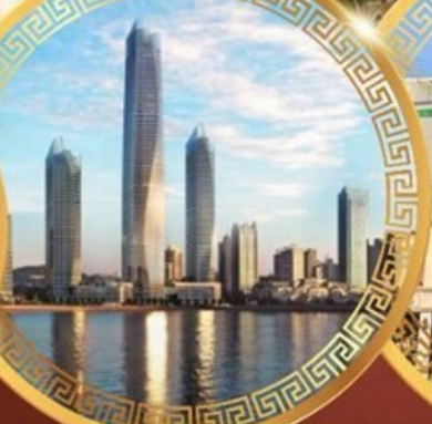
ชมวิวดาคารไฮตัน เซ็นเตอร์