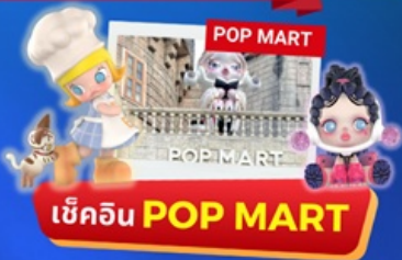
เช็คอิน POP MART