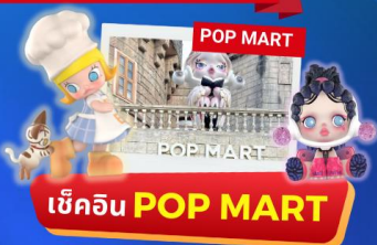
เช็คอิน POP MART