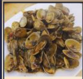
ผัดหอยลาย