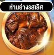
หมูย่างรสเลิศ