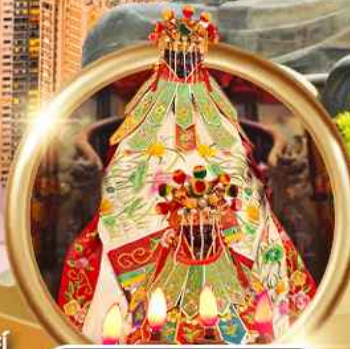
ยี่เป็งเจ้าแม่กวนอิมฮ่องกง