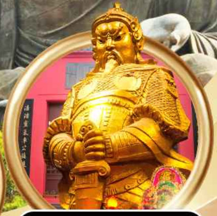
วัดเซกหงหิว