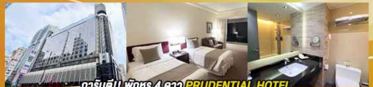
гарันตี!! พักหรู 4 ดาว PRUDENTIAL HOTEL ติดถนนนาธาน ย่านช้อปปิ้งจิมซาจู้