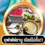
บุฟเฟ่ต์ชาบู เบียร์ไม่อั้น!!