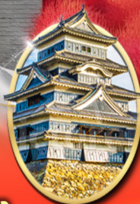
ปราสาทนัตสึโมโด้

รหัสทัวร์ RJ-VZNR004 เดินทาง 5D 3N ท.ย. - ต.ค. 69