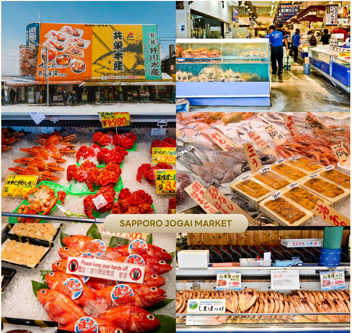
SAPPORO JOGAI MARKET