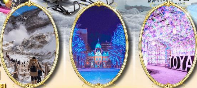
Jigokudani Noboribetsu | Sapporo White Illumination | Lake Toya Onsen Illumination Tunnel