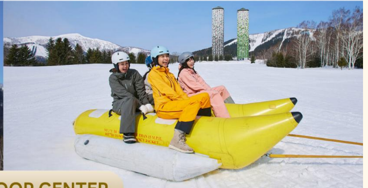
GAO OUTDOOR CENTER