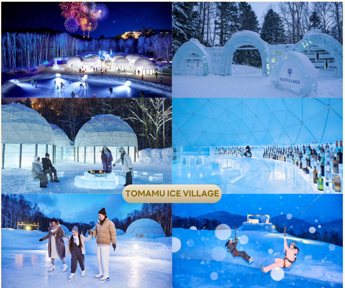
TOMAMU ICE VILLAGE

จากนั้นนำท่านเดินทางสู่ HOSHINO RESORT TOMAMU เพื่อนำท่านสู่ TOMAMU ICE VILLAGE ซึ่งตั้งอยู่ใน โฮชิโนะริ สอร์ทโทมามุ ( Hoshino Resort Tomamu ) เป็นหมู่บ้านชั่วคราวที่สร้างขึ้นจากการแกะสลักน้ำแข็งในช่วงฤดูหนาวเท่านั้น บ้านน้ำแข็งแต่ละหลังมีการประดับประดาแสงไฟสีสับต่างๆ ห้างดงามมากยิ่งขึ้น นอกจากนี้ให้การเก็บภาพความสวยงามของบ้านน้ำแข็งแล้วยังมีกิจกรรมอื่นๆ อีกมากมาย เช่น Zipline on Ice จะเคลื่อนตัวลงมาเป็นระยะทางประมาณ 60 เมตร ระหว่างทางคุณจะได้ชื่นชมทิวทัศน์ของหิมะ และลานน้ำแข็งที่น่าอัศจรรย์ Ice Bakery & Cafe คาเฟ่ที่ให้บริการเครื่องดื่มร้อน และขนม ที่ให้ท่านนั่งทานบนโต๊ะและเก้าอี้น้ำแข็ง Ice Bar บาร์ที่บริการเครื่องดื่มประเภทค็อกเทล และเครื่องดื่มแอลกอฮอล์อื่น ๆ หลายชนิด ที่เสิร์ฟในแก้วน้ำแข็งสวย ๆ เป็นต้น (ราคาทัวร์ไม่รวมค่ากิจกรรม และค่าเครื่องดื่ม Ice Bar, Ice Bakery & Cafe) **หมายเหตุ : การเปิดให้บริการของ Tomamu Ice Village ขึ้นอยู่กับสภาพอากาศเป็นหลัก ทั้งนี้ หากอุณหภูมิเพิ่มสูงขึ้นจนส่งผลให้น้ำแข็งละลายเร็ว อาจทำให้ต้องปิดให้บริการก่อนกำหนดที่วางไว้ ขอสงวนสิทธิ์ทดแทนเป็นรายการอื่น หรือคืนค่าใช้จ่ายในส่วนนี้ตามความเหมาะสม** ใช้เวลาเดินทางประมาณ 1 ชั่วโมง