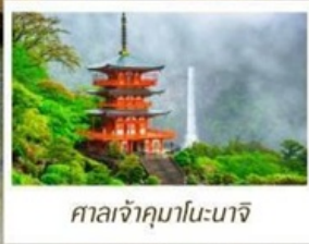
ศาลเจ้าคามาโนะนาจิ