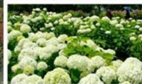
ชมดอกไม้ไฮเดรนเยีย