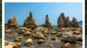
ชายหาดหินฮาชิคุอิวะ

🧳 โหลด 23 KG. x2 ( รวม 46 KG. ) ทั้งไป - กลับ