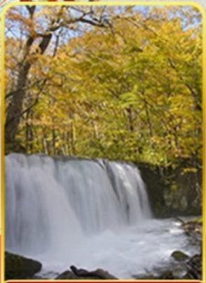
ลำธารโออิราสะ