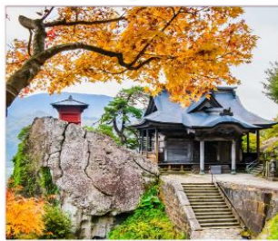
วัดยามาเดระ