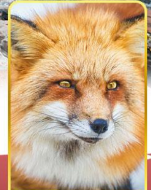
ฟาร์มสุนัขจิ้งจอก