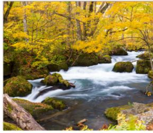
เดินเล่นลำธารโออิราสะ