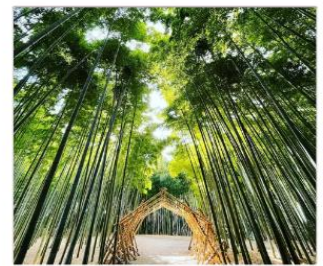
ป่าไผ่วากายามะ