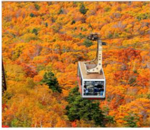
นั่งกระเช้าฮักโกดะ