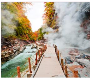
ชมเขาโอยาสึเดียว