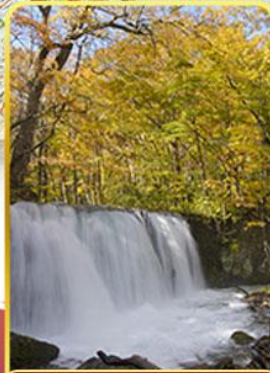
ลำธารโออิราเสะ