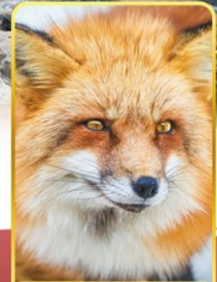
ฟาร์มสุนัขจิ้งจอก