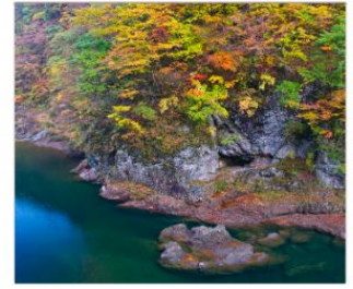
ชมเขาดากิไดริ