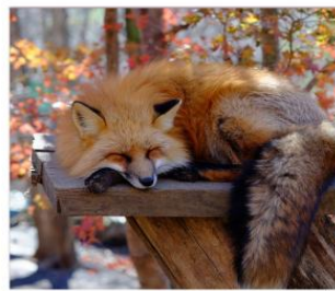
ฟาร์มสุนัขจิ้งจอก