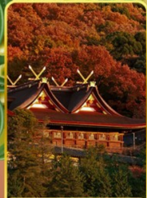
ศาลเจ้าคิบิฮิโกะ