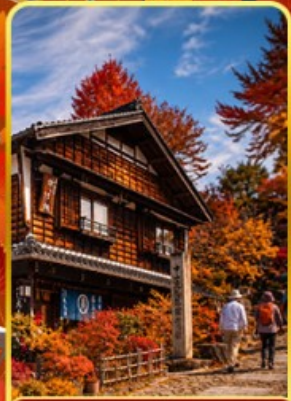
หมู่บ้านมาโกเมะจุกุ