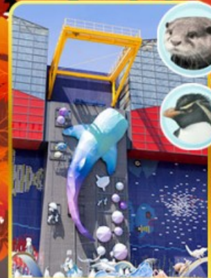
พิพิธภัณฑ์โคยูกิจิ

ออนเซ็น 2 คั้น นน.กระเป๋า 23 กก.X2 8Days 5Night