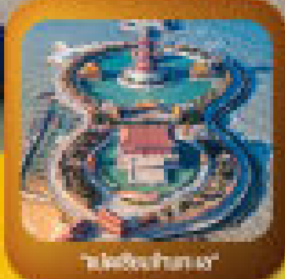
"สวนสาธารณะ"

แหล่งเมืองเก่าเมืองท่าของจีน - ถนนเปียก - สวนสาธารณะ เมืองโบราณ - กำแพงเมืองเก่า - สวนสาธารณะ - สวนสาธารณะ เมืองเก่า - สวนสาธารณะ - สวนสาธารณะ - สวนสาธารณะ สวนสาธารณะ - สวนสาธารณะ - สวนสาธารณะ - สวนสาธารณะ