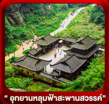
“ อุทยานหลุมฟ้าสะพานสวรรค์ ”