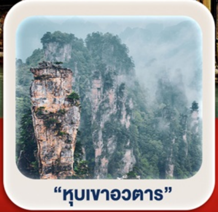
“หุบเขาอวตาร”