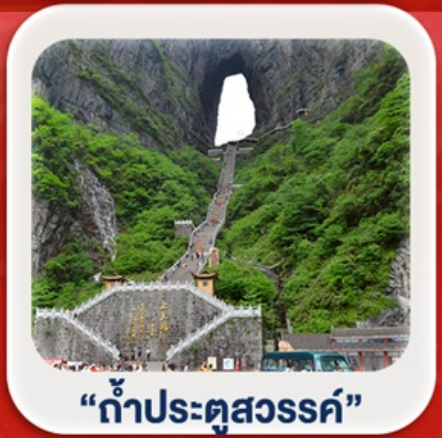
“กำประตูลิ่วหวง”