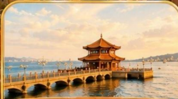
สะพานจันเจียว Zhanqiao Pier