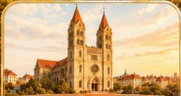
โบสถ์เซนต์ไมเคิล St. Michael's Cathedral

พิพิธภัณฑสถาน เบียร์ชิงเต่า พิเศษ! ชิมเบียร์สดชิงเต่า 1 แก้ว