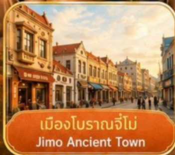
เมืองโบราณจี้โม Jimo Ancient Town