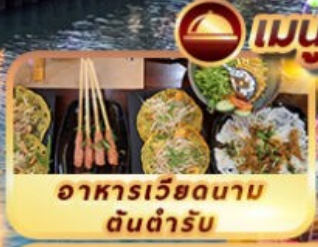
อาหารเวียดนาม ต้นตำรับ