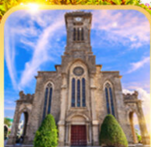
โบสถ์หินญางจาง