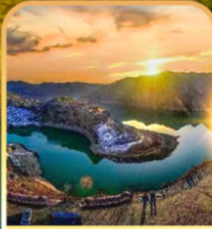
หุบเขาแม่น้ำฮวงเหอ