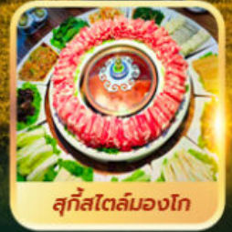
สุกีสโตล์มองโก