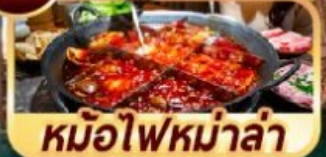
หม้อไฟหม่าล่า