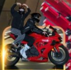
ถ่ายวีดีโอนั่งมอเตอร์ไซด์

ชิมหม้อไฟหม่าล่า นั่งรถรางชมธรรมชาติ หนาวเสียวระเบิดงิ้วแก้ว