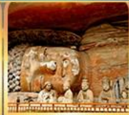
พาศินพระแกะสลักต้าจู๊