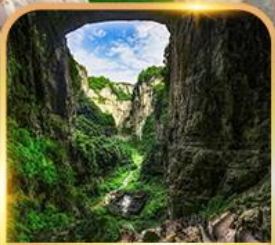
อุทยานหลุมฟ้า 3 สะพานสวรรค์