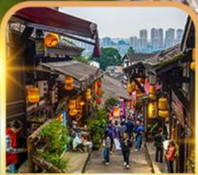
หมู่บ้านโบราณฉือชี่โจว