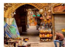
ตลาดخانเอลคาลีสี่

20.50 น. ออกเดินทางสู่อิสตันบูล เที่ยวบิน TK695