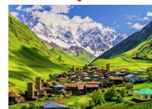
หมู่บ้าน Ushguli

** พักที่ Best Western Hotel หรือเทียบเท่า **