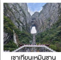
เขากียนเหมินซาน

ฉลองเที่ยวบินปฐมฤกษ์ เก็บครบทุกไฮไลต์!! วันที่ 10 พฤษภาคม 2569 กรุงเทพฯ - อางซา (จางเจียเจีย)