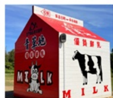
ฟาร์มโคนมจินเหมิน