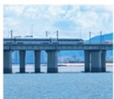
นั่งรถไฟใต้ดินข้ามทะเล