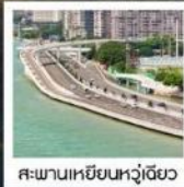
สะพานเหยียนหวู่เจียว