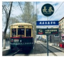
นั้งรรางดางซุน