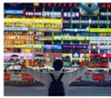
กำแพงมหาวิทยาลัยเหยียนเปียน