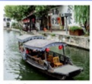
เมืองโบราณหนานสวิน