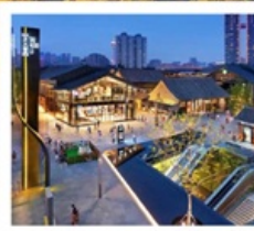
ถนนคนเดินไท่กู่หฺลี่