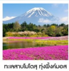
ทะเลสาบโมโตสุ กุ้งพืงค์มอส