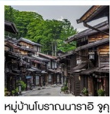
หมู่บ้านโบราณนารายิ จุกุ