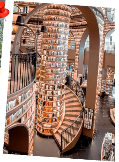
○ จัตุรัสหยางเทียนวู แพนด้าเซลฟี และ ห้องสมุดงูชูกอ