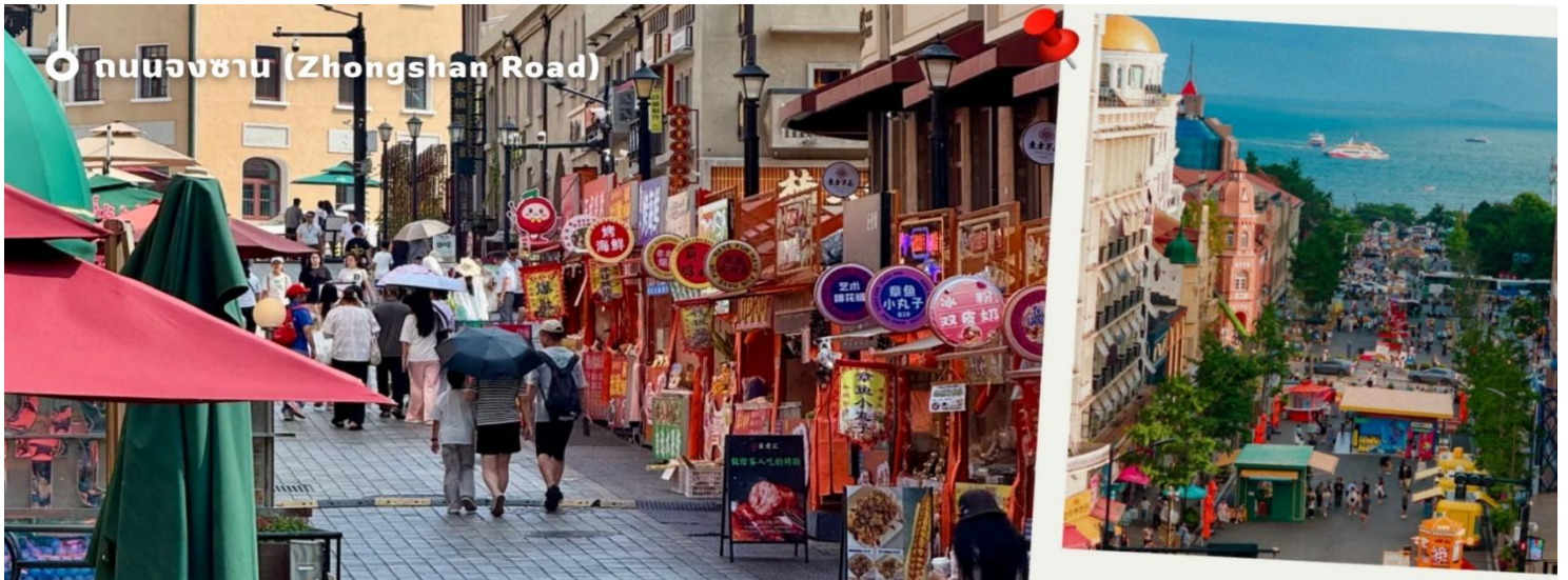
ถนนจงซาน (Zhongshan Road)

และเก็บความประทับใจท่ามกลางเมืองท่าริมทะเลที่มีเสน่ห์แห่งนี้ นับเป็นอีกหนึ่งจุดหมายยอดนิยมที่ไม่ควรพลาดเมื่อมาเยือนเมืองชิงเต่า