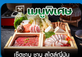
เช็ตทานู ซาบู สไตล์ญี่ปุ่น

ซัปโปโร-หมู่บ้านน้ำแข็ง-กระเช้าอุไค-ลานสกีซิกไซโนะ-สวนสัตว์อาซาฮิยาม่า-โอตารุ-โรงงานช็อกโกแลต-ซ้อปปิงทานุกิโคจิ-เที้ยวเต็มไม่มีอิสระ