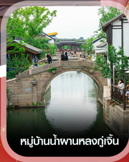
หมู่บ้านน้ำผานหลงกู่เจิน

เช็คอิน พาณู เยือนถิ่นกำเนิดเจ้าแม่กวนอิม เกาะผู้โล่่วซาน เที่ยวเมืองเก่า ผานหลงกู่เจิน ไหว้พระหยกขาวอันศักดิ์สิทธิ์