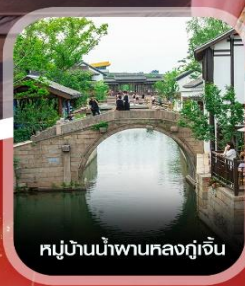
หมู่บ้านน้ำผานหลงกุ่เจิน