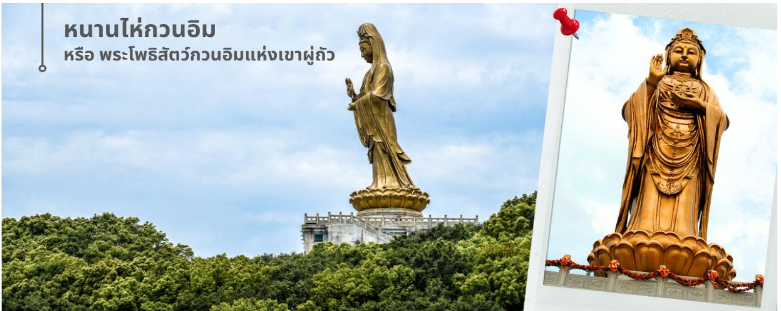
หนานไท่กวนอิม หรือ พระโพธิสัตว์กวนอิมแห่งเขาผู้ถั่ว

สามารถออกเรือได้ และทำให้ต้องสร้างศาลไว้บูชาองค์เจ้าแม่ตั้งแต่นั้นมา ซึ่งคนส่วนใหญ่ที่มาสักการะองค์เจ้าแม่กวนอิม ไม่ยอมไป มักจะขอเรื่องการเดินทางให้มีความปลอดภัยจากนั้นนำท่านกราบขอพรพระโพธิสัตว์กวนอิม หนานไท่กวนอิม หรือ พระโพธิสัตว์กวนอิมแห่งเขาผู้ถั่ว องค์ใหญ่และงดงามที่สุดในเกาะ สูงถึง 28 เมตร ซึ่งประดิษฐานอยู่ที่ ตำนักริมทะเล หรือ หนานไท่กวันยิน เป็นประติมากรรมแบบจีนรูปพระโพธิสัตว์กวนอิม ซึ่งเป็นจุดหมายตาสำคัญของ เขาผู้ถั่ว เมืองโจวซาน ทางตอนตะวันออกของมณฑลเจ้อเจียง ประเทศจีน ประติมากรรมสูง 33 เมตร และหนัก 70 ตัน ได้รับทุนและก่อสร้างโดยผู้ศรัทธาชาวจีนทั้งในและต่างประเทศ อันเป็นสถานที่ศักดิ์สิทธิ์ที่ชาวผู้ถั่วซาน ให้ความสำคัญพ นับถือมายาวนานกว่า 2,000 ปี