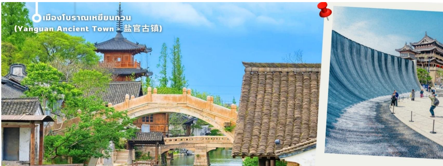
เมืองโบราณเหยียนกวน (Yanguan Ancient Town - 盐官古镇)

แวะชมผลิตภัณฑ์จากหยก งานฝีมืออันสวยงาม ขึ้นชื่อของจีนถือว่าถ้าใครมาจีนต้องแวะชมผลงานที่ผลิตจากหยก น่าเก็บสะสมเป็นอย่างมาก จากนั้นนำท่านเดินทางกลับเมือง เซี่ยงไฮ้ (ใช้เวลาเดินทางประมาณ 2 ชั่วโมง) นำท่านช้อปปิ้งย่าน ถนนนานจิง Nanjinglu Street ศูนย์กลางสำหรับการช้อปปิ้งที่คึกคักมากที่สุดของนครเซี่ยงไฮ้ รวมทั้งห้างสรรพสินค้าใหญ่ชื่อดังกว่า 10 แห่ง และช้อปปิ้ง ร้าน POP MART สุดฮิตในขณะนี้เพื่อเป็นของฝากที่ระลึก นำท่านสู่บริเวณ หาดว้ายทาน ตั้งอยู่บนฝั่งตะวันตกของแม่น้ำหวงผู้มีความยาวจากเหนือจรดใต้ถึง 4 กิโลเมตร เป็นเขตสถาปัตยกรรมที่ได้ชื่อว่า “พิพิธภัณฑ์สิ่งก่อสร้างหมื่นปีแห่งชาติจีน” ถือเป็นสัญลักษณ์ที่โดดเด่นของมหานครเซี่ยงไฮ้