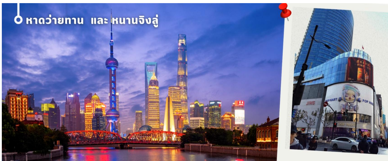
หาดว้ายทาน และ หนานจิงลุ

แวะชมผลิตภัณฑ์จากหยก งานฝีมืออันสวยงาม ขึ้นชื่อของจีนถือว่าถ้าใครมาจีนต้องแวะชมผลงานที่ผลิตจากหยก น่าเก็บสะสมเป็นอย่างมาก จากนั้นนำท่านเดินทางกลับเมือง เซี่ยงไฮ้ (ใช้เวลาเดินทางประมาณ 2 ชั่วโมง) นำท่านช้อปปิ้งย่าน ถนนนานจิง Nanjinglu Street ศูนย์กลางสำหรับการช้อปปิ้งที่คึกคักมากที่สุดของนครเซี่ยงไฮ้ รวมทั้งห้างสรรพสินค้าใหญ่ชื่อดังกว่า 10 แห่ง และช้อปปิ้ง ร้าน POP MART สุดฮิตในขณะนี้เพื่อเป็นของฝากที่ระลึก นำท่านสู่บริเวณ หาดว้ายทาน ตั้งอยู่บนฝั่งตะวันตกของแม่น้ำหวงผู้มีความยาวจากเหนือจรดใต้ถึง 4 กิโลเมตร เป็นเขตสถาปัตยกรรมที่ได้ชื่อว่า “พิพิธภัณฑ์สิ่งก่อสร้างหมื่นปีแห่งชาติจีน” ถือเป็นสัญลักษณ์ที่โดดเด่นของมหานครเซี่ยงไฮ้