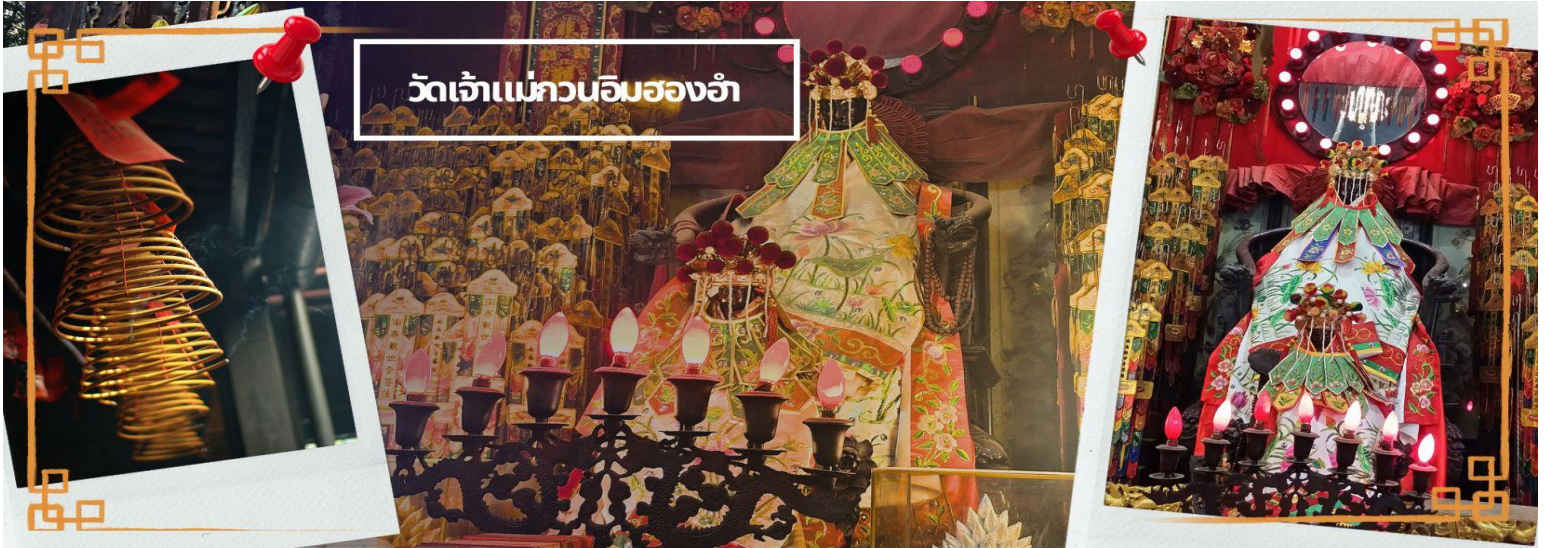
วัดเจ้าแม่กวนอิมของอ้า

ท่านชม โรงงานจิวเวอรี ซึ่งเป็นโรงงานที่มีชื่อเสียงที่สุดของฮ่องกงในเรื่องการออกแบบเครื่องประดับ อาทิเช่น จี้ และแหวนกำหันทน์ ที่สวยงามโดดเด่นไม่มีใครเหมือนใคร ซึ่งถือกำเนิดขึ้นที่นี่และมีชื่อเสียงที่สุดใช้เป็นเครื่องประดับติดตัว และเสริมดวงชะตา สินค้าทุกชิ้นมีเอกสารรับประกันคุณภาพเปลี่ยน ซ่อม ใต้ตลอดอายุการใช้งาน หากเกิดการชำรุดจากสินค้าไม่ใช่อุบัติเหตุ และนำท่านเลือกซื้อ เครื่องประดับที่ ร้านปีเจียะ ซึ่งคนจีนนั้นถือว่าปีเจียะ หรือเผ่เย้า ที่ทำจากหยกที่เป็นตัวแทนของความสวยงามและความบริสุทธิ์ มีความเชื่อว่าหยกมีพลังมงคล เสริมอายุยืนและสุขภาพดี และปีเจียะในตำนานลูกหลานมังกร ช่วยหาเงินหาทอง กินไม่รู้จุกอิม เชื่อว่าเป็นสัตว์นำโชค สู้คร่าวเรือน