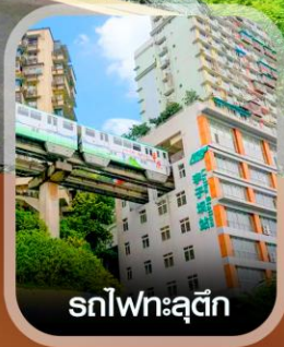
รถไฟฟ้าตุ๊ก