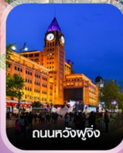
ถนนหวังฟูจิ่ง

✈️ คอนเฟิร์ม ออกเดินทาง ทุกพีเรียด 2 ท่านขึ้นไป