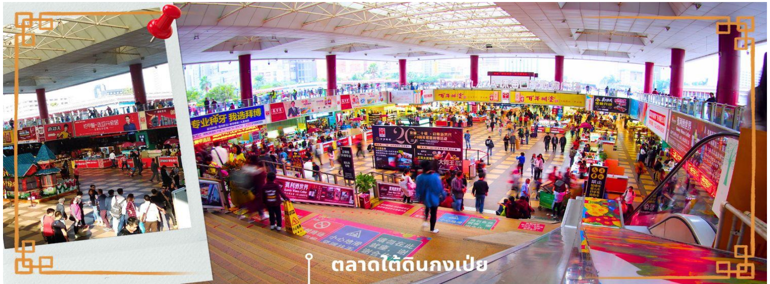
ตลาดใต้ดินกงเป่ย

นำท่านเข้าสู่ที่พัก IRVINE HOLIDAY HOTEL หรือเทียบเท่า