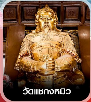
วัดแซกซงหมิว