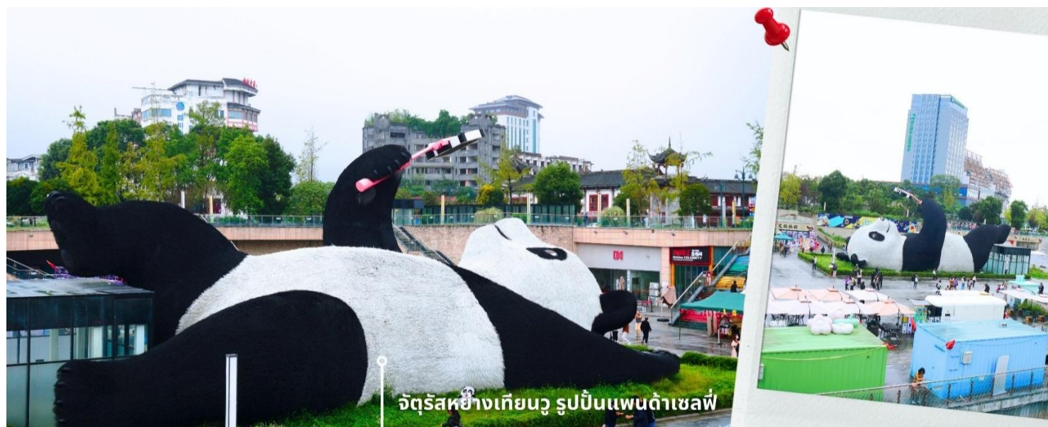
จัตุรัสหยางเทียนวู รูปปั้นแพนด้าเซลฟี่

นำท่านเที่ยวชม จัตุรัสหยางเทียนวู เป็นจุดเช็คอินที่สำคัญสำหรับคนที่มาเที่ยวที่ เมืองตูเจียงเยียน บริเวณจุดท่าข้าม อำเภอตูเจียงเยียน นครเฉิงตู ไฮไลท์ของจัตุรัสหยางเทียนวู คือ ประติมากรรม แพนด้ายักษ์ ที่กำลังนอนหงายท้อง ยื่นมือถือไม้เซลฟี่สีชมพู ซึ่งออกแบบโดยนักออกแบบชื่อดัง Florentijn Hofman รูปปั้นแพนด้า ยักษ์มีความยาว 26 เมตร กว้าง 11 เมตร สูง 12 เมตร และหนัก 130 ตัน แบบท่าทางสบายๆของแพนด้าที่สร้างความประทับใจและ รอยยิ้มให้กับผู้มาเยือนจัตุรัสหยางเทียนวู สามารถดึงดูดนักท่องเที่ยวได้เป็นจำนวนมากเลยทีเดียว เป็นการ แสดงออกด้วยภาษาทางศิลปะแบบหนึ่งที่สะท้อนชีวิตในท้องถิ่น มอบความรู้สึกสนิทสนมและมีความสุขกับผู้ชม อิสระเดินชมถ่ายภาพ รูปปั้นแพนด้าเซลฟี่ ตามอัธยาศัย ที่นี่เป็นจุดเช็คอินที่เหมาะสมสำหรับทุกเพศทุกวัย หากคุณ กำลังมองหาสถานที่ท่องเที่ยวใหม่ๆ ที่เต็มไปด้วย ความทรงจำดี จัตุรัสหยางเทียนวู คือคำตอบที่สมบูรณ์แบบ