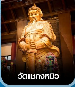
วัดแห่งกมวิ