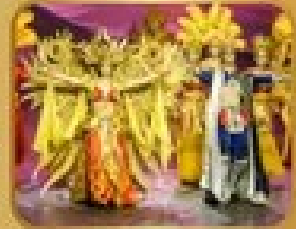
ชมการแสดงละครเวที