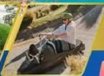
เล่นลuge ที่กรีนสทาวน์

AUCKLAND / ROTORUA / CHRISTCHURCH FOX GLACIER / FRANZ JOSEF / QUEENSTOWN พิกจ็อคแลนด์ 2 คืน / โรโตรัว 1 คืน / พิกคริสตchurch 2 คืน พิกฟรานซ์โจเซฟ 1 คืน / ควีนส์ทาวน์ 2 คืน