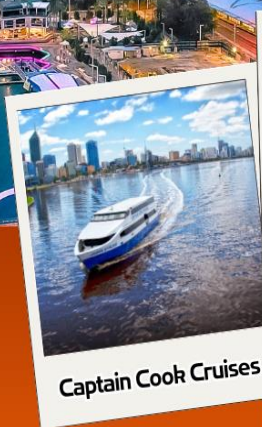
Captain Cook Cruises