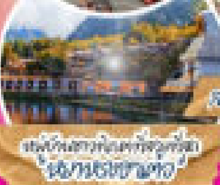
ชมวิถีชีวิตและทิวทัศน์ที่สวยงาม

เดินทางวันที่ 1 - 4 และวันที่ 5 - 8 ไปทางรถบัสส่วนตัว - อาหารเช้าทุกวัน (รวมอาหารเช้า) 2 คืนที่โรงแรม 4 ดาว 1 คืนที่โรงแรม 3 ดาว - 2 คืนที่โรงแรม 3 ดาว - 1 คืนที่โรงแรม 3 ดาว - 1 คืนที่โรงแรม 3 ดาว และ THE TOWER OF LIFE ที่เมืองต้าหลู - 1 คืนที่โรงแรม 3 ดาว - 1 คืนที่โรงแรม 3 ดาว - 1 คืนที่โรงแรม 3 ดาว