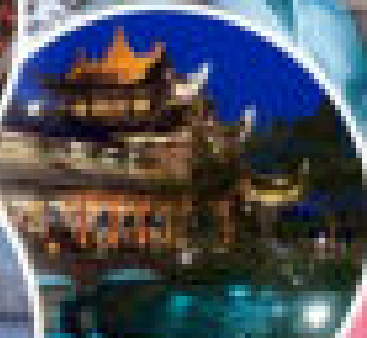
ที่พักหรูระดับ 4 ดาว