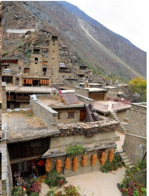
หมู่บ้านโบราณเซียงเถาผิง (Taoping Qiang Village)