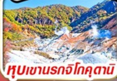
หุบเขานรกโจคุตานิ

รวม ค่าภาษีที่ปรับขึ้นแล้ว (ประกาศ 1 เม.ย. 69)