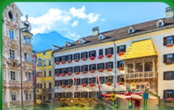
หลังคาทองคำ อินส์บรุค