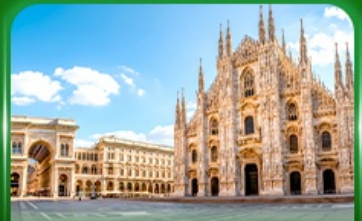
มหาวิหารดูโอโมแห่งมิลาน