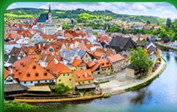
เมืองมรดกโลก เซสที่ครุมลอฟ