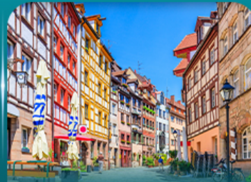
เที่ยวเมืองเก่าบูร์มเบิร์ก