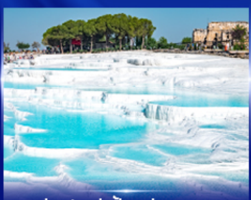
ปราสาทบุนยาดียา บามุกคาเล