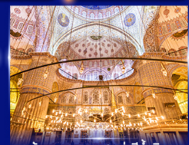
เข้าชมความงามสุเหร่าสีน้ำมึน