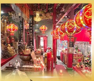
ศาลเจ้ากวนอู คลองสาน