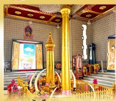
ศาลหลักเมือง กรุงเทพมหานคร