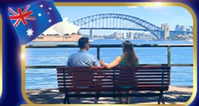
ชมวิวอ่าว สวนน้ำหินแบคควอร์รี่