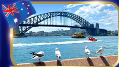
เข็คอินสะพานซิดนีย์อาร์เบอร์