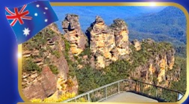
ชั้นชมวิวกีอากซานลูมาน์เทนส์