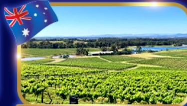
ชมไร่องุ่น โรมันบิว์ระดับโลก