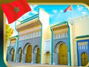
ประตูประราชวังหลวง